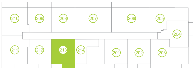
Půdorys podlaží/ Floor plan